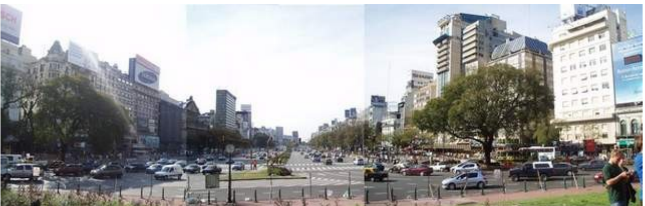
Die Avenida 9 de Julio

Im Rahmen der ersten 10 Tage fand unser On-Arrival-Training statt, welches von unseren Vorgängern organisiert wurde. Ziel dabei war es, uns die argentinische Kultur und vor allem Buenos Aires näher zu bringen.