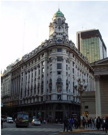
„Old to the New“

Nicht nur bezüglich Arm und Reich gibt es viele Gegensätze in BsAs, sondern zum Beispiel auch in der Architektur. Alte europäisch-anmutende Architektur neben neuen, modernen, gläsernen Bürogebäuden. Oder die Porteños (Bewohner von Bs.As.), die sich mitten im hektischen Stress der Großstadt und im Menschengewimmel der Bürgersteige schön brav hintereinander in eine Reihe stellen um an der Haltestelle auf den Bus zu warten.