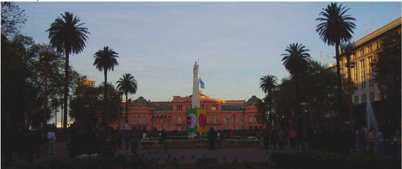
Plaza de Mayo (Casa Rosada im Hintergrund)

An einem Abend waren wir noch essen – und zwar Steak. Ich durfte eines der besten 500-Gramm „leichten“ Rindersteaks essen. Das frische Fleisch wurde direkt auf einem großen Grill ( Parilla ) gegrillt und saftig-rosa serviert. Jetzt weiß ich warum Argentinien unter anderem auch für sein Rindfleisch bekannt ist... :-)