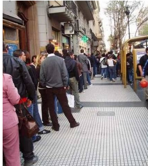
Auf den Colectivo warten